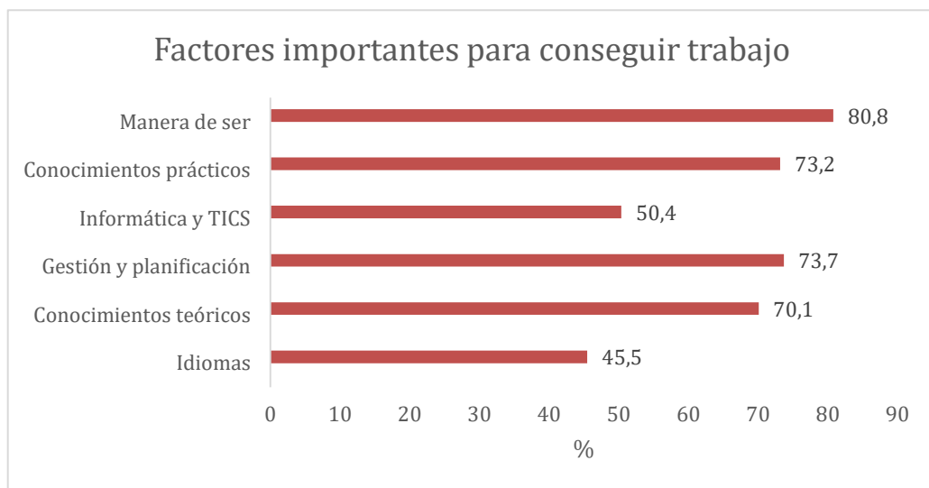
Figura 2. Factores importantes para conseguir trabajo (Encuesta de inserción Laboral de Titulados Universitarios. INE, 2014)

Así, podemos ver en la Figura 2, elaborada a partir de encuestas a universitarios, como un 80,8% de ellos consideran que su “manera de ser” les ha facilitado la obtención de un trabajo cualificado, por lo que muchos podrían pensar que el valor añadido de un universitario serían sus conocimientos teóricos y prácticos, pero la realidad es que existen otros aspectos que parecían secundarios que engloban la manera de ser de una persona los que obtienen una mayor importancia. Estas capacidades que van más allá de lo cognitivo podrían parecer difíciles de clasificar, cuantificar y de identificar su papel en el éxito laboral. Pero estas habilidades no cognitivas no solo pueden medirse sino que además, en diversos estudios ya mencionados, se ha demostrado que repercuten en los resultados educativos y laborales; habilidades como la motivación, la perseverancia, la diligencia, la empatía, la organización, la responsabilidad, etc. son relevantes en un rango extenso de empleos. Así, las ocupaciones de los universitarios dependen sustancialmente de este tipo de habilidades para conseguir un trabajo adecuado a la formación. Se observa como la manera de ser ha sido más relevante en puestos de directivos y gerentes, ingenieros, abogados, economistas, profesionales de ciencias sociales y profesores que los conocimientos teóricos y prácticos.